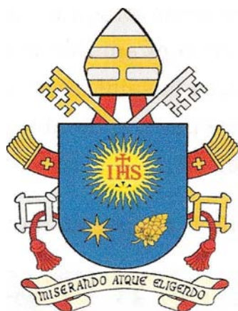
Le blason du Pape

nos fautes. Elle est la tendresse maternelle, la compassion de Dieu à notre endroit. « Le Seigneur ne se fatigue jamais de pardonner: jamais ! C'est nous qui nous fatiguons de lui demander pardon » 2 .