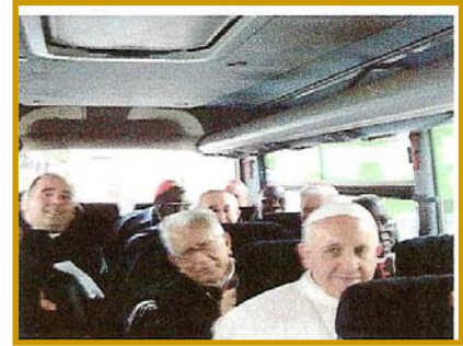
Le Pape en autobus

Dès le début de son pontificat, Jorge Mario Bergoglio a adopté un mode de vie plus dépouillé que ses prédécesseurs ; il a refusé la mosette (petite cape) rouge qui se porte par-dessus l'habit blanc ; il a choisi de garder ses souliers au lieu